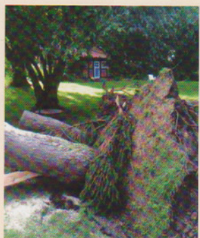
Vor der Fräsung

Sprechen Sie mich an, wenn ich bei Ihnen Wurzeln, Stubben etc. entfernen soll oder sogar eine Baumfällung bei Ihnen anliegt, ich berate natürlich kostenlos und vermittele mit meinen Partnern gern auch Komplettpakete.