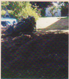
Nach der Fräsung